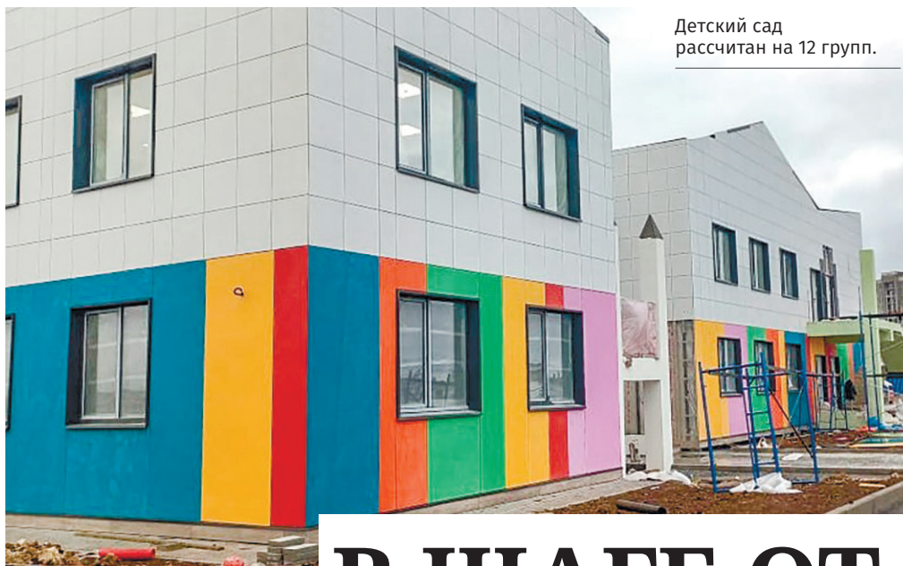
Детский сад рассчитан на 12 групп.