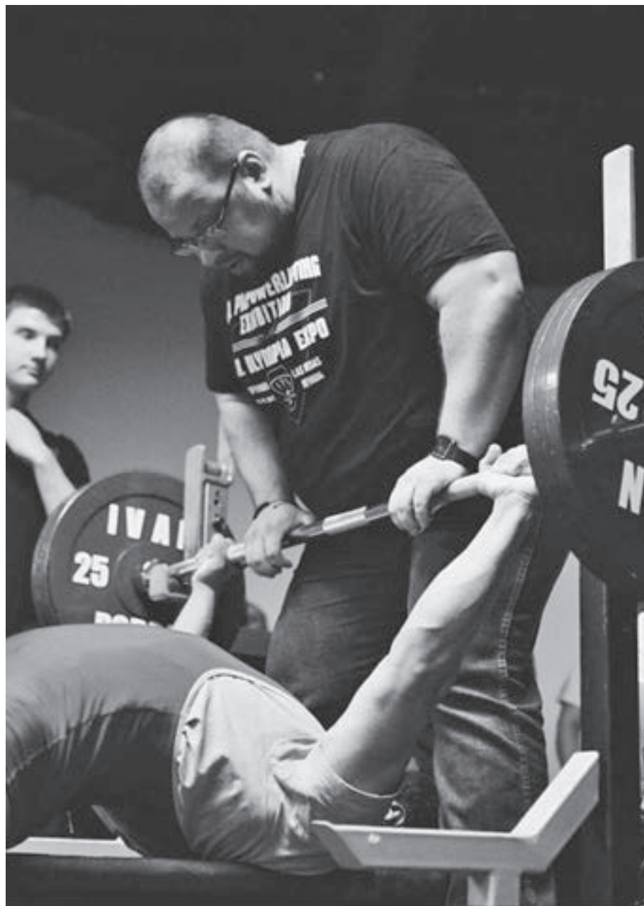
В Симферополе в рамках турнира «Могущество атлантов» соревновались самые сильные люди полуострова.

– Мы увидели здесь очень большой потенциал. Показатели у крымчан всегда были высокими, однако сейчас они в большинстве своём такие, что и на международном уровне не то что не стыдно, а мы и вовсе выглядим фаворитами во