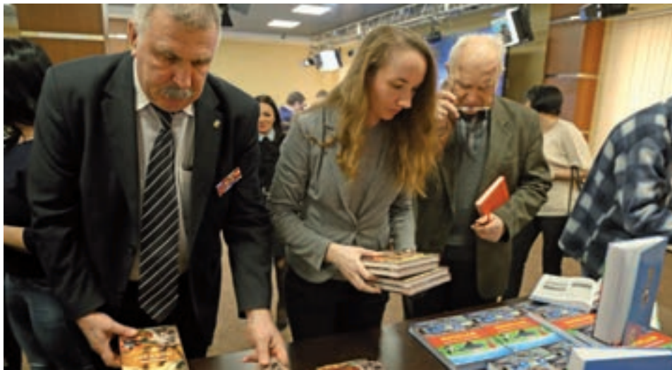
Интересных крымских изданий становится всё больше.

В этот раз свет увидели произведения общественно-политического содержания, поэтические сборники, литературно-документальное, а также спортивное справочное издание.