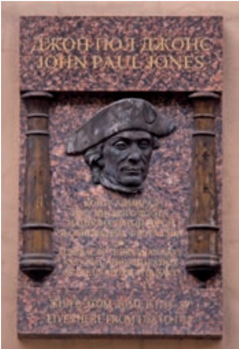
Мемориальная доска адмиралу Джонсу в Санкт-Петербурге.

Джон Пол Джонс поражал своей военной наглостью не только морских офицеров