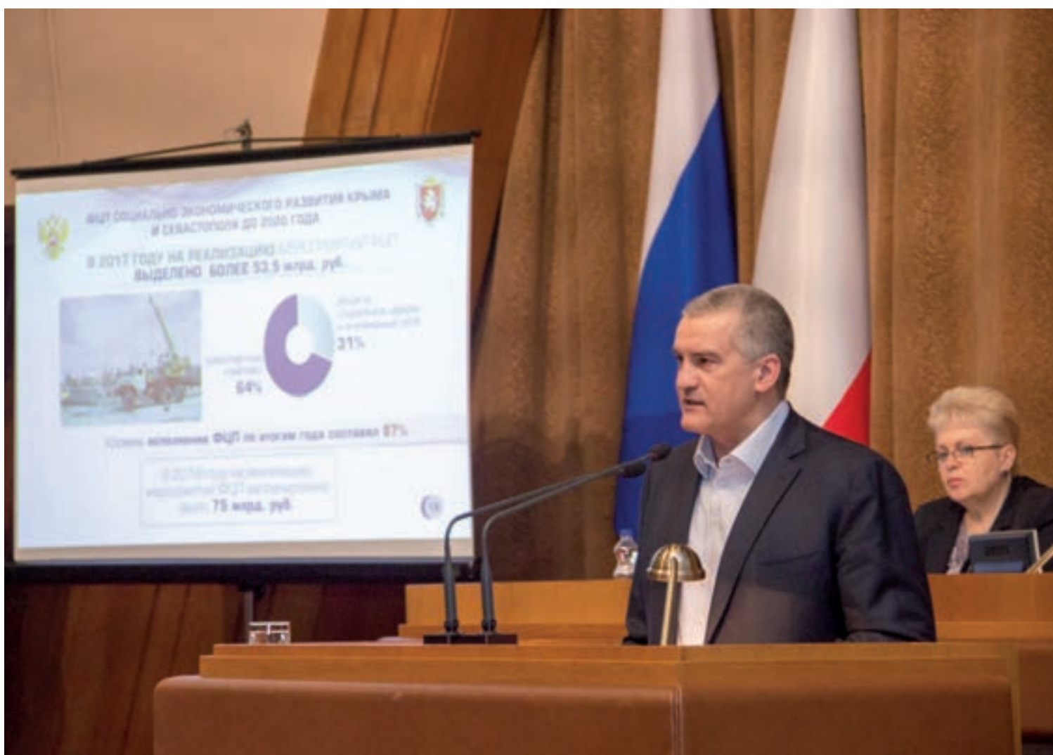
30 марта. Госсовет РК. Глава Крыма Сергей Аксёнов отчитался о работе правительства в 2017 году.

Депутат Государственной Думы РФ Дмитрий БЕЛИК о том, что дата освобождения Крыма от немецко-фашистских захватчиков может быть объявлена Днём воинской славы.