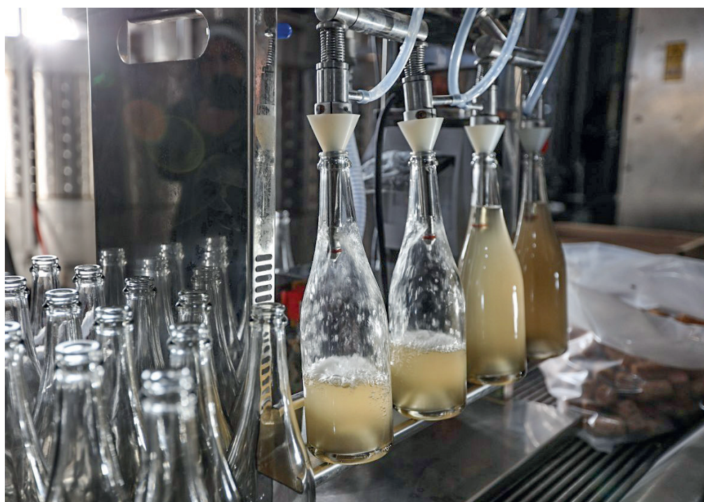
После того как вино разлили по бутылкам, оно проходит выдержку.

– Органический виноград – это чистый виноград. При выращивании мы не используем никакие синтетические средства защиты и удобрения. То есть только природные материалы. Они используются и при защите виноградника, и при удобрении. Это такой старый дедовский способ производства винограда – сто лет