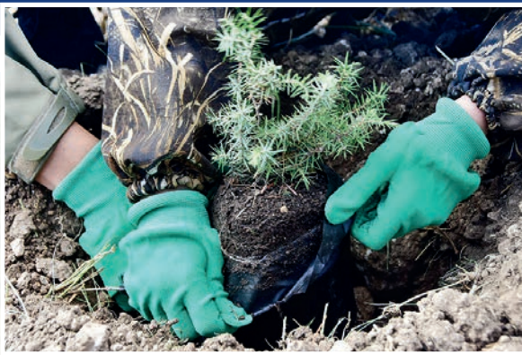
Детвора из школьного старокрымского лесничества «Росток» с удовольствием участвует в высадке новой можжевельной рощи.

В Старом Крыму восстанавливают выгоревшие лесные участки