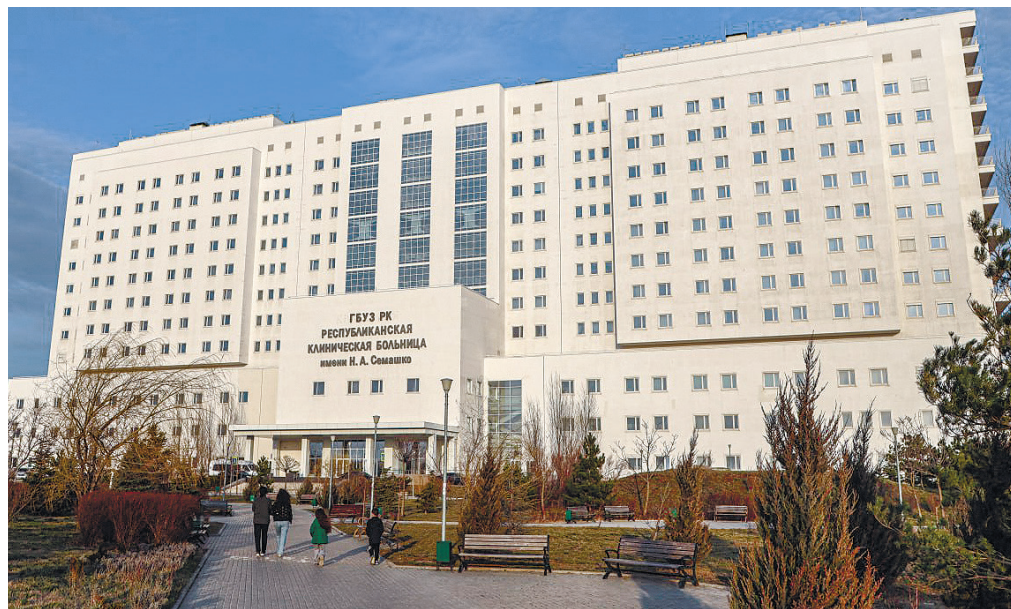
Два из шести региональных сосудистых центров расположены в Многопрофильном республиканском медицинском центре им. Н. А. Семашко.

865 единиц медицинского оборудования было поставлено в сосудистые центры и отделения за последние пять лет.