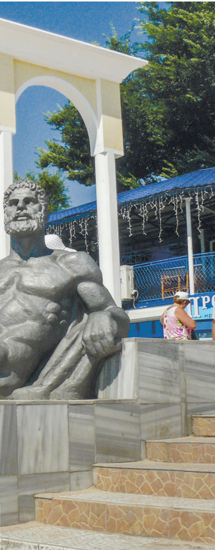
Памятник Гераклу: «Весь мир – для подвигов, но Евпатория – для отдыха!»