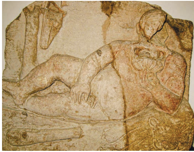
Титульный экспонат краеведческого музея – античная скульптура «Пирующий Геракл».

ренных органов, поэтому принимать её следует в ограниченных количествах, желательно по назначению врача. Гражданам, желающим просто утолить жажду, в этом же бювете предлагается питьевая вода из артезианской скважины.