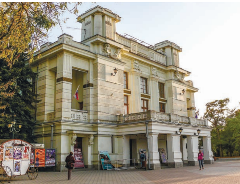
Архитектура евпаторийского театра несёт ярко выраженные черты античности.

мушки не слишком выразительны. Но специалисты в восторге: они видят здесь части оборонительной стены, жилого помещения, круглой башни с плитовой вымосткой и даже жертвенник! Дополняют руины предметы домашней утвари из фондов музея. Подлинные свидетельства давно ушедшей жизни заботливо накрыты стеклянным куполом. Его пирамидальная форма говорит, что Керкинитиды скрыта от пустого сердца и ленивого глаза и откроется только тем, кто способен проникнуть в её тайны.