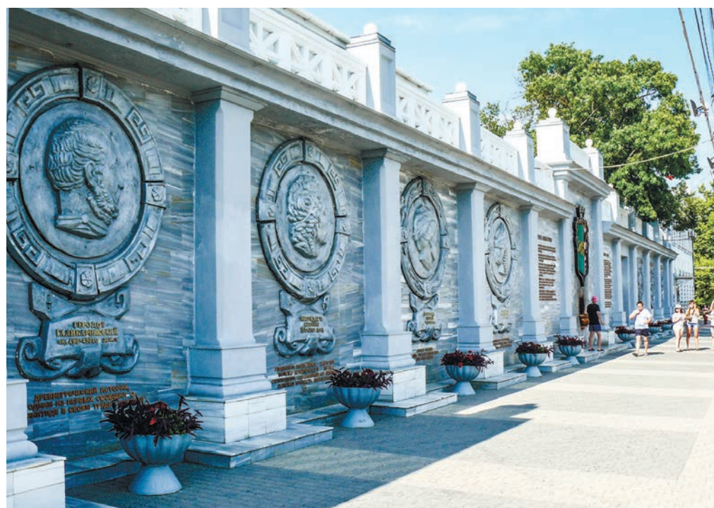
Мемориальная стена повествует о важнейших страницах истории Евпатории.

Хорошая вода всегда была и остаётся символом благополучия города и здоровья