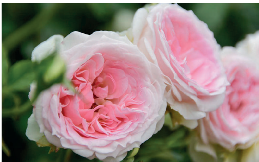
Сегодня в саду представлены 1,2 тысячи сортов роз. Большинство из них в цвету.