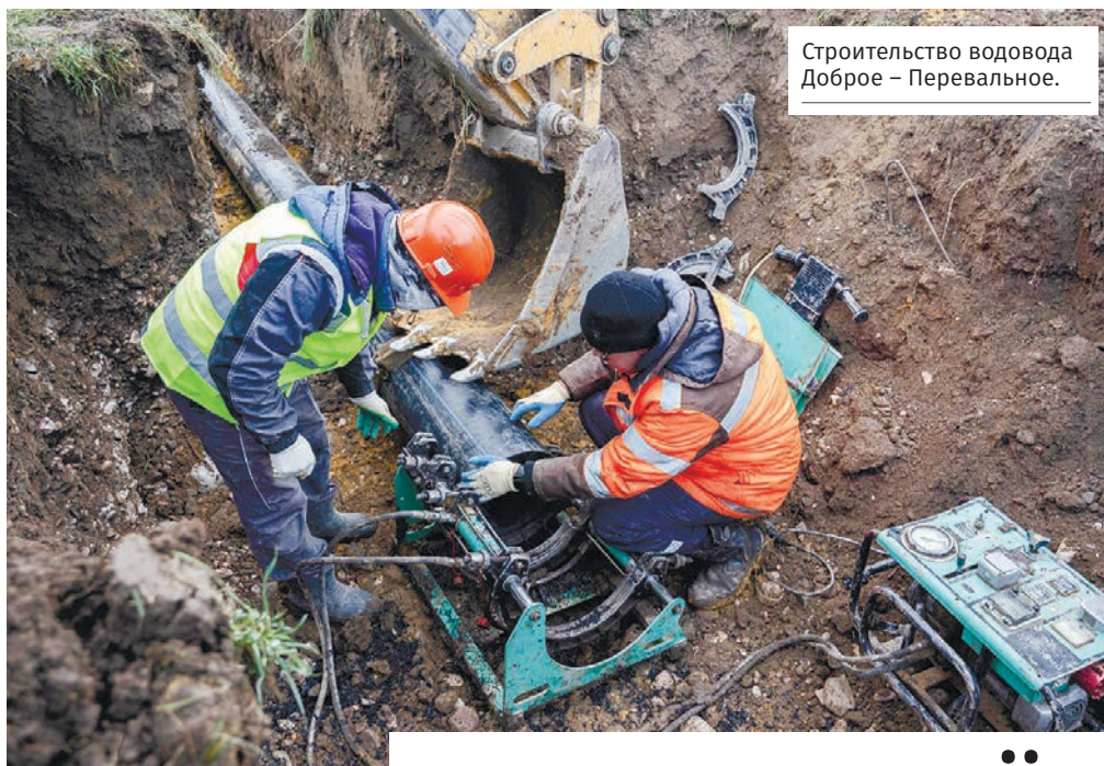
Строительство водовода Доброе – Перевальное.