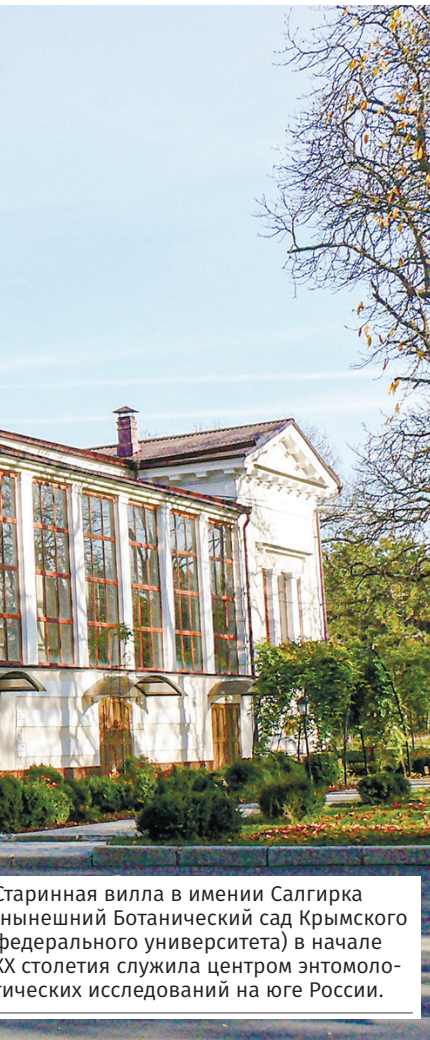
Старинная вила в имении Салгирка нынешний Ботанический сад Крымского федерального университета) в начале XX столетия служила центром энтомоло- гических исследований на юге России.