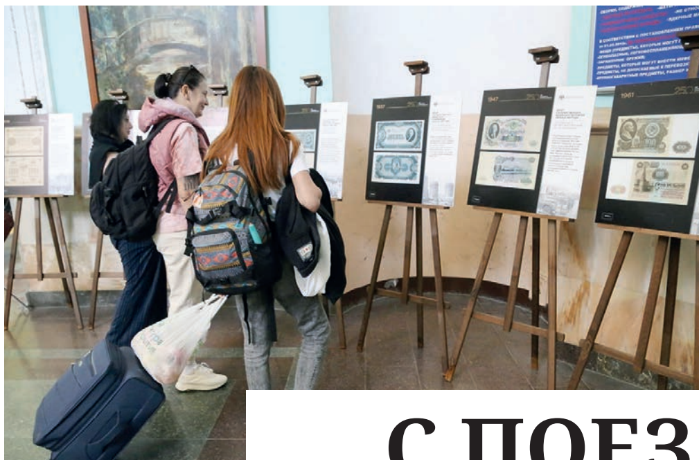
В ожидании поезда туристы могут узнать об истории денег.