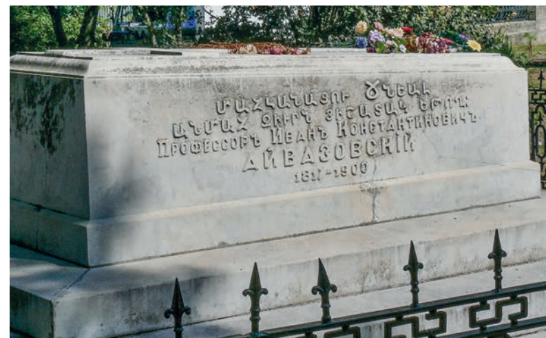
Звание профессора высечено на мраморном надгробии Айвазовского.

Человек без роду без племени добился своим трудом всех возможных благ, которые выражались не только деньгами и недвижимостью. Именными указами Александра II Айвазовский стал первым почётным гражданином Феодосии и потомственным дворянином. Состоя на государственной службе, он был произведён в действительные тайные советники (гражданский чин,