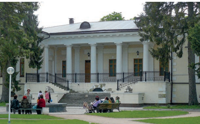
Во время обучения в симферопольской гимназии Иван Айвазовский был частым гостем в доме Натальи Нарышкиной (ныне памятник архитектуры и истории в университетском ботаническом саду).

“АЙВАЗОВСКИЙ – И ПО СТАРШИНСТВУ, И ПО МОЩИ ТАЛАНТА – СТАЛ ЗАЧИНАТЕЛЕМ, СОЗДАТЕЛЕМ ВОЛШЕБНОЙ СТРАНЫ КИММЕРИИ. СО ВРЕМЕНЕМ «БЕРЕГ ОЧАРОВАННЫЙ» ДАЛ ПРИСТАНИЩЕ ДЛЯ ПЛЕЯДЫ РОМАНТИКОВ И ФАНТАЗЁРОВ – ГОРДОСТИ ОТЕЧЕСТВЕННОЙ КУЛЬТУРЫ