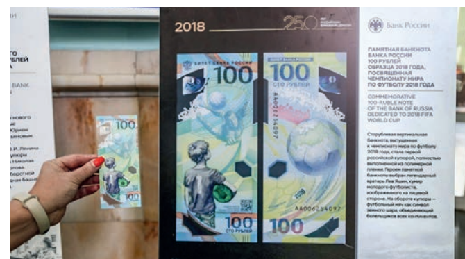
На выставке представлены современные полимерные купюры.

Выставка Банка России «250 лет российским бумажным деньгам» открылась вчера в фойе вокзала Крымской железной дороги.