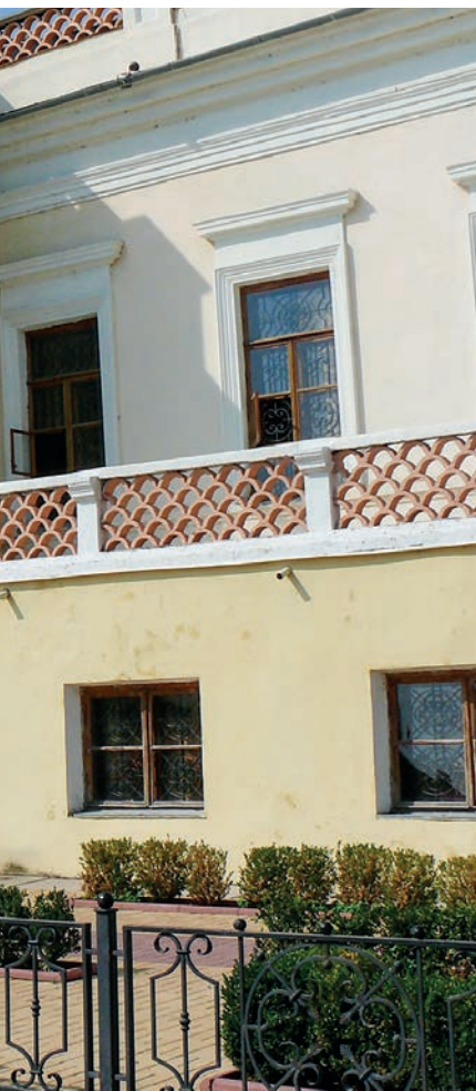
Дом художника в Феодосии похож на итальянскую виллу эпохи Возрождения.