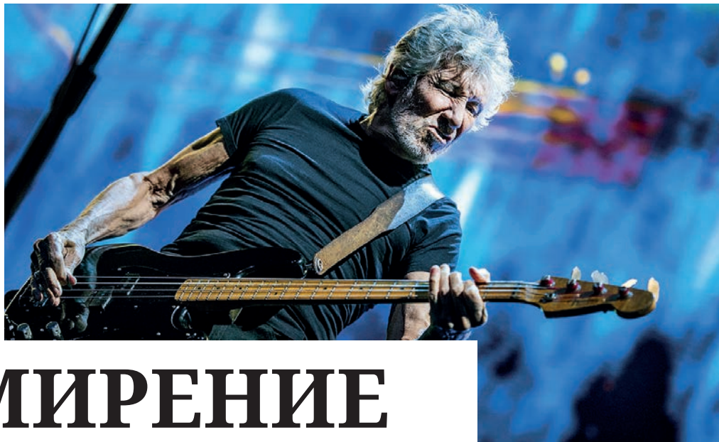
Ещё четыре года назад за позицию по Украине Роджера Уотерса внесли в базу данных украинского сайта «Миротворец».

Он также призвал работать сообща над защитой станции для установления зоны обеспечения ядерной сохранности и безопасности.