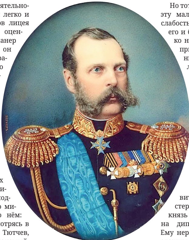
Император Александр II. 1870-е годы. Портрет работы А. М. Вегнера.

При этом от наблюдательных современников не ускользнула склонность Горчакова к некоторому тщеславию и самолюбиванию. Отто фон Бисмарк, считавший князя своим учителем в вопросах внешней политики, писал в мемуарах, что «подчинённые Горчакова по министерству говорили о нём: «Он любит себя, смотрясь в чернильницу», а Фёдор Тютчев, близко с Горчаковым знакомый, в связи с этим даже дал ему шутовское прозвище – «нарцисс собственной чернильницы».