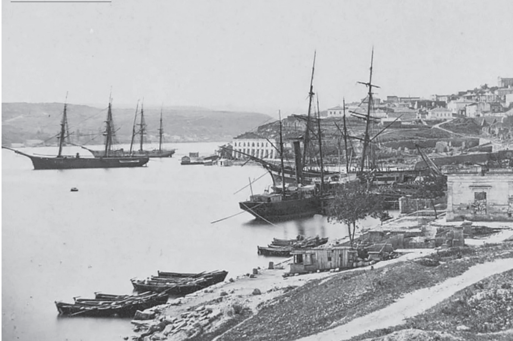
Бухта Севастополя, 1870-е годы. Начало возрождения Черноморского флота.

Уже в ранней юности Горчаков проявлял качества, указывавшие на его талант именно