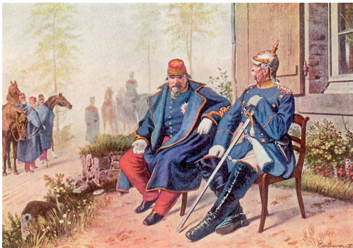
Отто фон Бисмарк и пленённый под Седаном император Наполеон III (картина Вильгельма Кампхаузена).

определённом его вошедшими в историю словами: «Россия не сердится, Россия сосредотачивается». Болезненно восприняв горечь поражения, он стал ждать удобного момента для реванша. Но не просто ждать, а кропотливо создавать условия, чтобы такой момент возник как можно скорее!