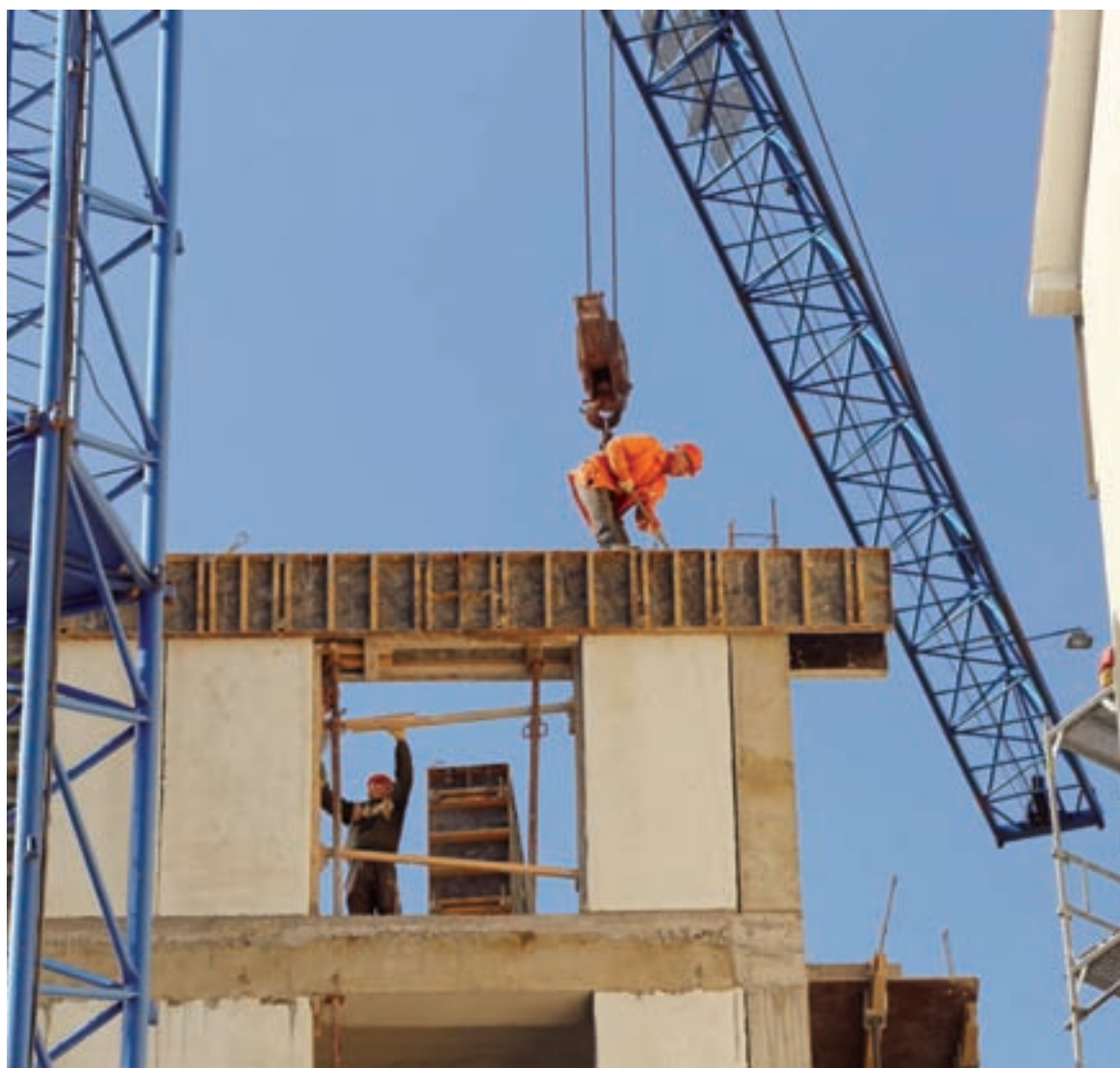
В строительстве вакансий всегда много.

Председатель комитета Госсовета РК по культуре и охране культурного наследия Светлана САВЧЕНКО об открытии 16 марта музея Крымской весны.