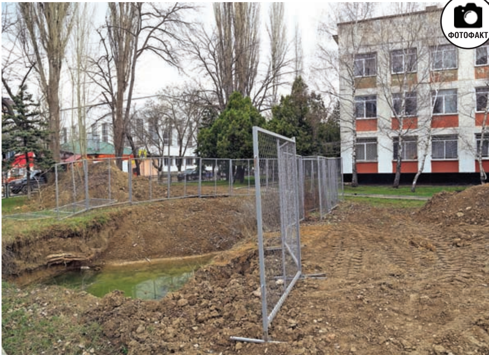
Симферополь, школа № 40. Яма с водой практически не огорожена.

Оформить подписку можно в любом отделении связи Крыма