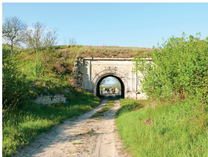
Все каменные сооружения Керченской крепости Тотлебен предусмотрительно защитил мощным слоем земли.

Придуманная Тотлебеном лопата оказалась настолько удобной, что спустя несколько лет русская армия официально взяла столь ценную вещь на вооружение. Практически без изменений она перешла в советскую армию, где получила название БСЛ-110 (большая сапёрная лопата длиной 110 см), и по сей день под тем же названием входит в комплекты абсолютно всей отечественной военной техники.