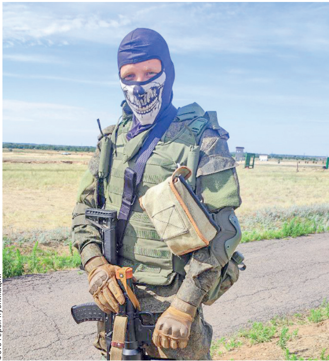
Фото героя публикации

Заслуги нашего собеседника пока что скромнее, чем у этих видных деятелей, однако с уверенностью можно