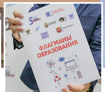
Проект стал ресурсом для профессионального развития и карьерного роста.

Действительно, кому же ещё решать сложные задачи, стоящие перед современным