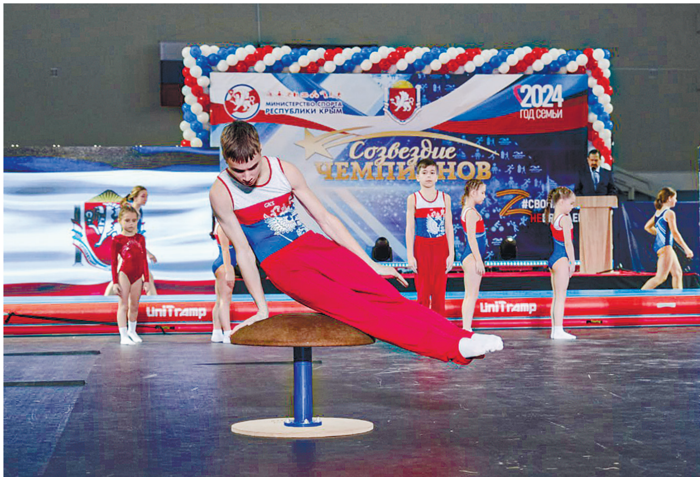
Перед награждением устроили настоящее спортивное шоу.

Сергей ЛАВРОВ, министр иностранных дел РФ, на презентации документального сборника «Крым в развитии России: история, политика, дипломатия. Документы архивов МИД России», переизданного к 10-й годовщине воссоединения.