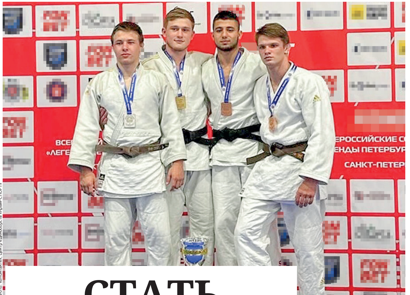
Фото: «ВКонтакте». Центр единоборств «Крым-СПОРТ».