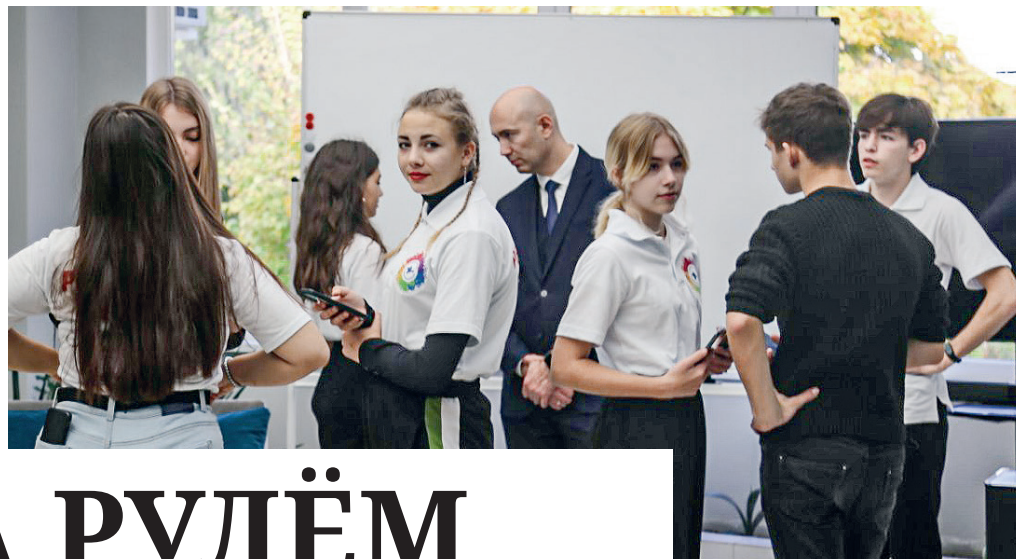
Школьники в перерыве задавали свои вопросы министру.

В Евпатории на территории детского оздоровительного лагеря «Гагарин» проходит ежегодный республиканский форум ученического самоуправления «Мы – будущее страны!». Участниками форума стали более 500 президентов общеобразовательных учреждений со всего Крыма. Для них организовали серии воркшопов, нетворкингов, мастер-классов, открытых образовательных площадок,