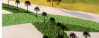
К чемпионату мира по футболу в Катаре построили семь новых стадионов и один реконструировали.