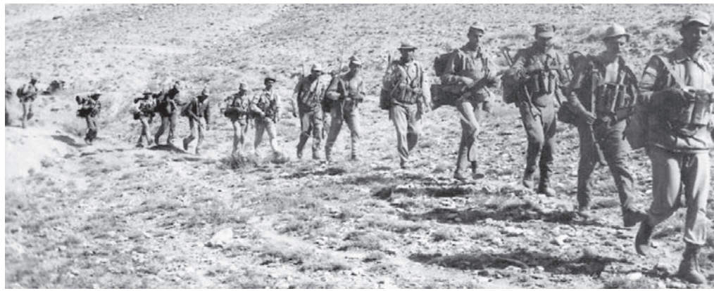
Пешими тропами Афганистана.

45 лет назад начался ввод советских войск в Афганистан.