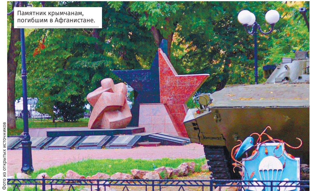
Памятник крымчанам, погибшим в Афганистане.