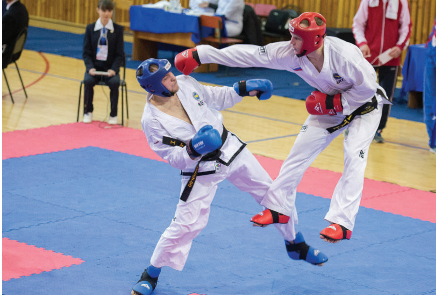
Порядка ста человек стали участниками республиканского турнира по тхэквондо в разделе МФТ, завершившегося в Симферопольском районе.

Сто спортсменов стали участниками республиканского турнира по тхэквондо в разделе МФТ