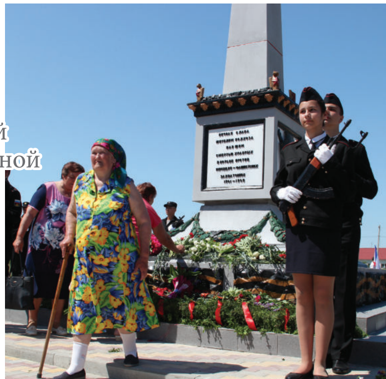
Митяевцы положили цветы к памятнику своим односельчанам.

Сумму, потраченную на восстановление памятника, Владимир Константинов не сообщил. Он подчеркнул, что в «такой торжествен-