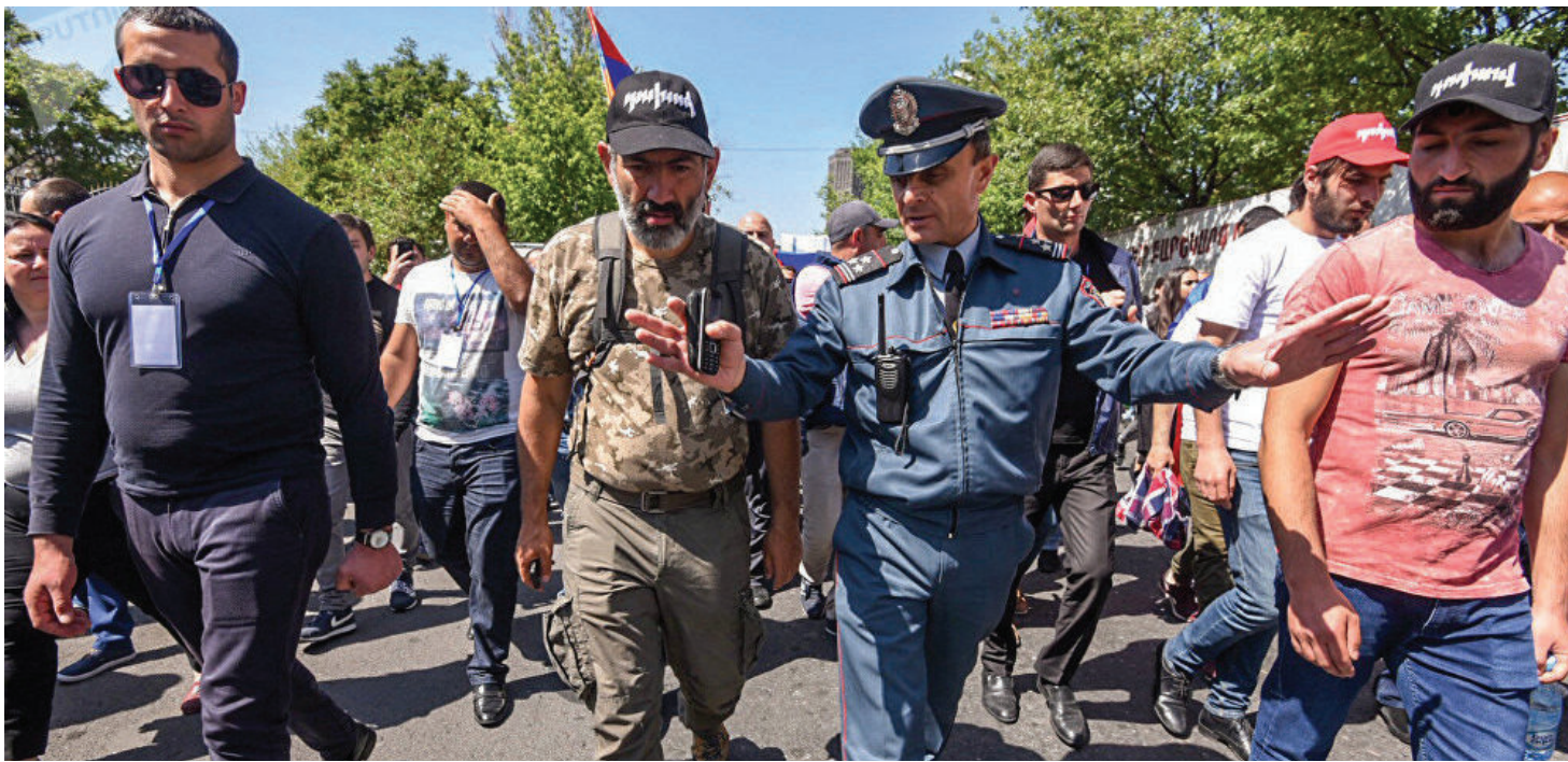
Никол Пашинян (на фото в центре) стал единственным кандидатом на должность премьер-министра.