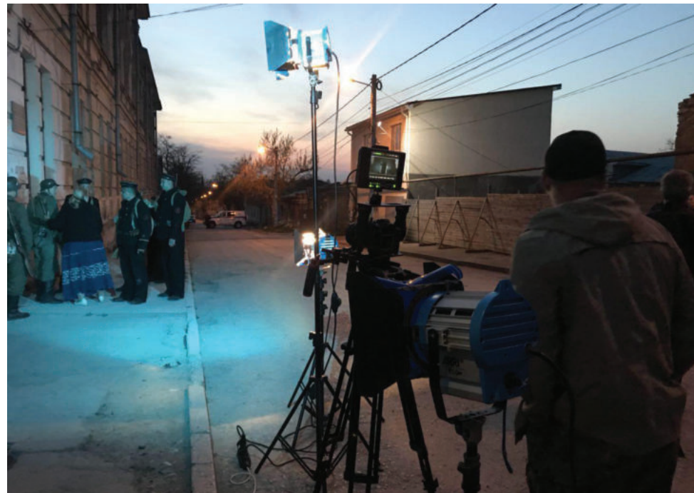
Съёмки фильма «Крымский фронт» в Симферополе, в районе Старого города.