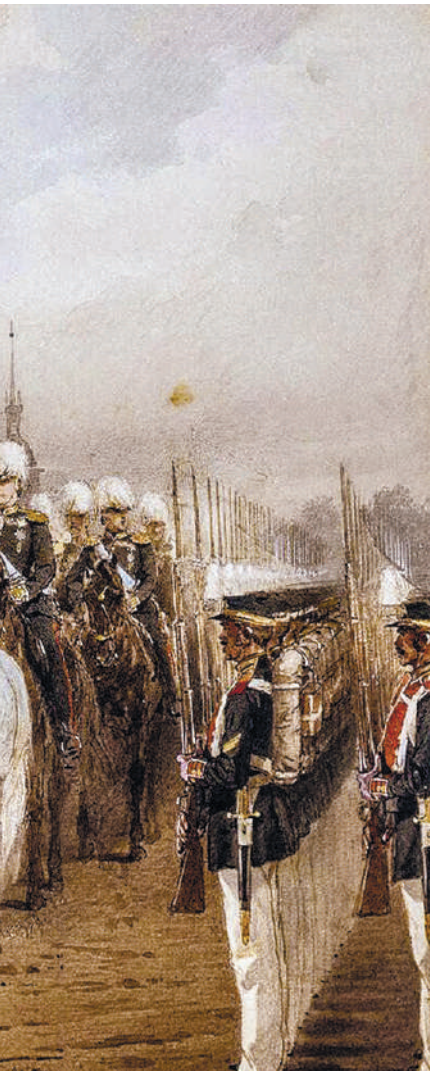
Использование двух флагов (цветов бело-сине-красного и чёрно-жёлто-белого) при Александре II и Насер ад-Дин Шах во время парада на Царицыном лугу. Художник М. Зичи. 1873 г. Эрмитаж.

требовал сразу после ухода французов поднять именно Государственный флаг. Решившись, Беловодский приказал поднять русский коммерческий флаг, который был сигналом к вступлению в город жандармской команды и сотни казаков. Штабс-