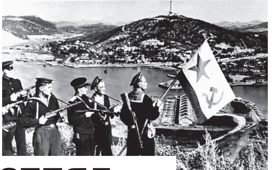
Моряки Тихоокеанского флота водружают флаг военно-морского флота над Порт-Артуром. Место съёмки: Порт-Артур. Август 1945 г. Евгений Халдей

Девятого мая 1945 года закончилась Великая Отечественная война, но 9 августа 1945 года продолжилась