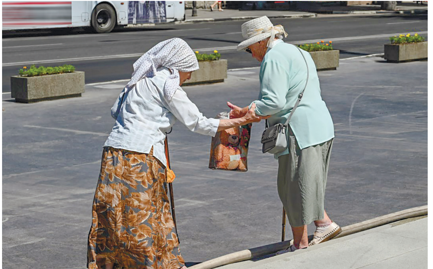
По программе долговременного ухода люди могут получить социальное обслуживание или медицинскую помощь на дому. Для этого привлекают сиделок или учат членов семьи правильно ухаживать за родственником.

Иван ОХЛОБЫСТИН, российский актёр кино и телевидения, кинорежиссёр, сценарист, продюсер, писатель.