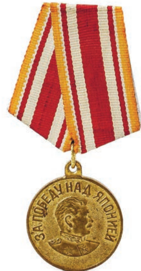
Медаль учреждена Указом Президиума Верховного Совета СССР от 30 сентября 1945 г. Положение о медали было дополнено Постановлением Президиума Верховного Совета СССР от 5 февраля 1951 г.

После успехов в Маньчжурии советские войска провели Южно-Сахалинскую наступательную операцию и высадили десанты на Курильских островах. В ходе операции на Курилах при поддержке кораблей Петропавловской военно-мор-