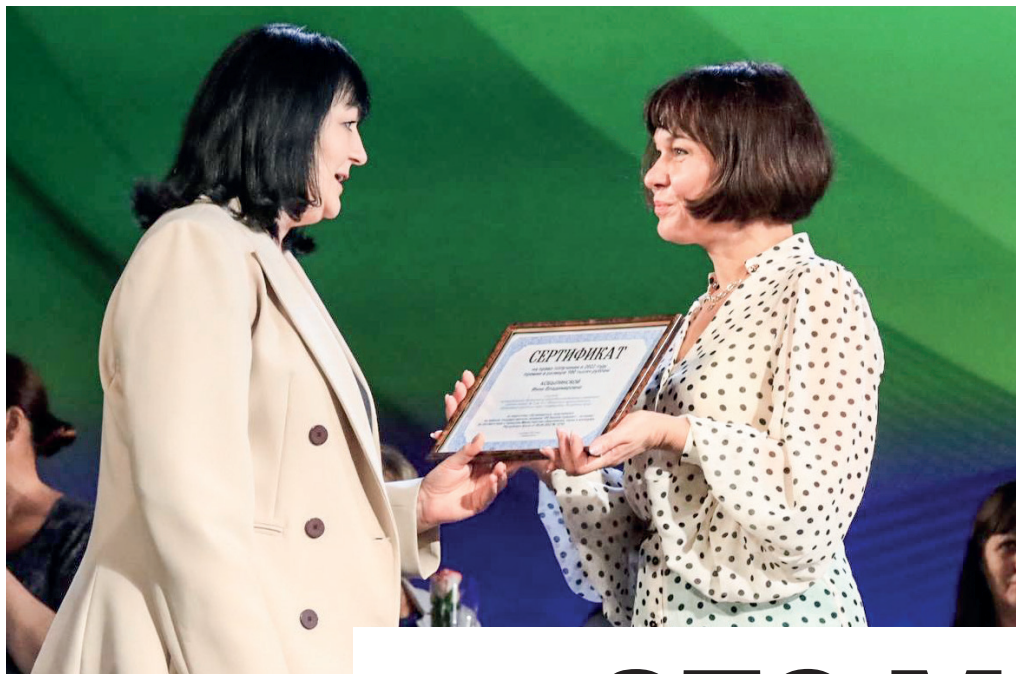
Учителя, подготовившие стобалльников на ЕГЭ, были удостоены премий.

В оспитатели в детском саду, учителя в школе, преподаватели в институте, наставники на работе – все эти люди формируют нашу личность наравне с родителями. В силах педагогов сделать из детей достойных граждан своей страны.