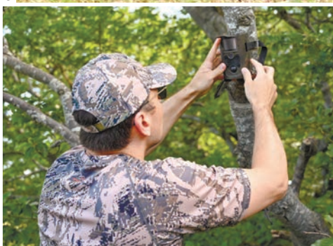
Для отслеживания численности краснокнижных пернатых экологи устанавливают в местах подкормки фотоловушки.