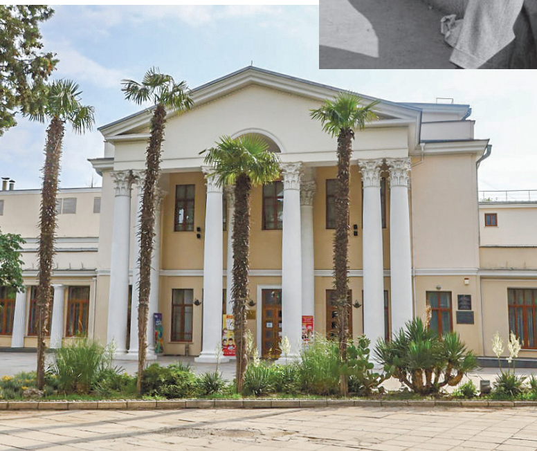
Ялтинский театр хорошо помнит легенду отечественной эстрады.

– Пока у меня хватит семечек, Перекопа не дам! – Почему семечек?