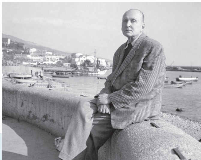
Александр Вертинский (1889–1957) – артист, композитор, поэт и певец, во время последних гастролей в Ялте летом 1956 года.

волшебный мир кино. Осенью 1952 года на Ялтинской киностудии снимали эпизоды советско-албанского фильма «Великий воин Албании Скандербег», повествующего о борьбе албанцев против турок в XIV столетии. Вертинский играл дожа Венеции.