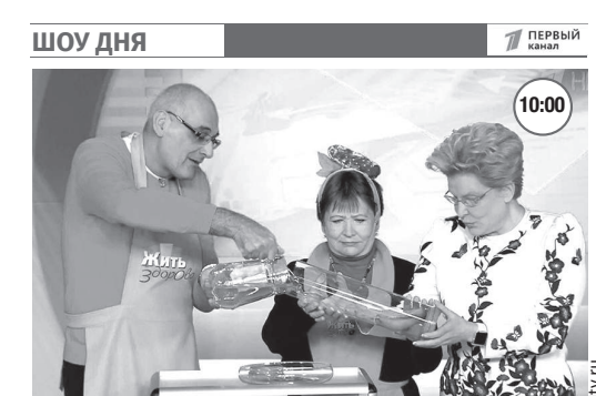
«ЖИТЬ ЗДОРОВО!» 16+

У доктора Джона Дулиттла есть, кажется, всё, о чём только можно мечтать: удавшаяся карьера, красивая жена и две прелестные дочки.