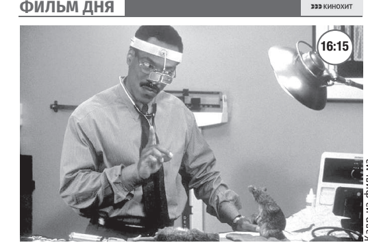
«ДОКТОР ДУЛИТТЛ» 12+

У доктора Джона Дулиттла есть, кажется, всё, о чём только можно мечтать: удавшаяся карьера, красивая жена и две прелестные дочки.