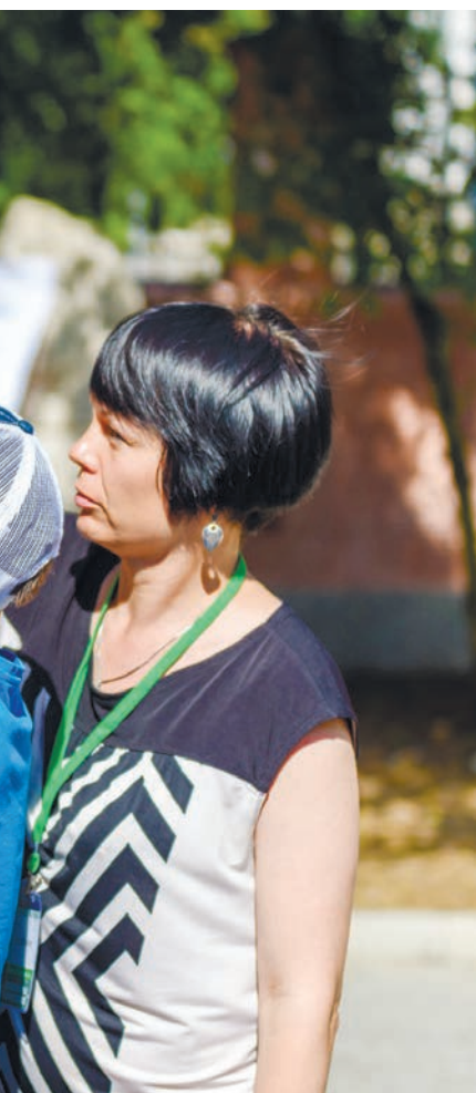
На выставке все желающие могли научиться плести маскировочные сети.