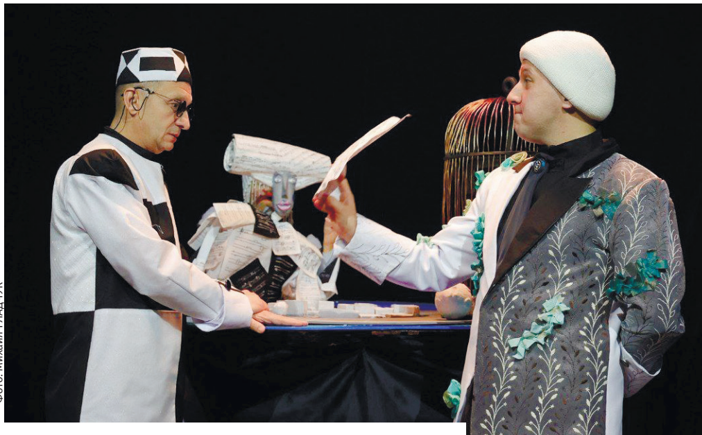
Сцена из спектакля «Моцарт и Сальери».

Знаменитое трагическое противостояние двух композиторов покинуло блистательную Вену и достигло поистине галактических масштабов. И не случайно постановке был придан такой вселенский антураж: крохотные планеты, светила, мистическое зеркало истории или же чёрная дыра, поглощающая и вы-