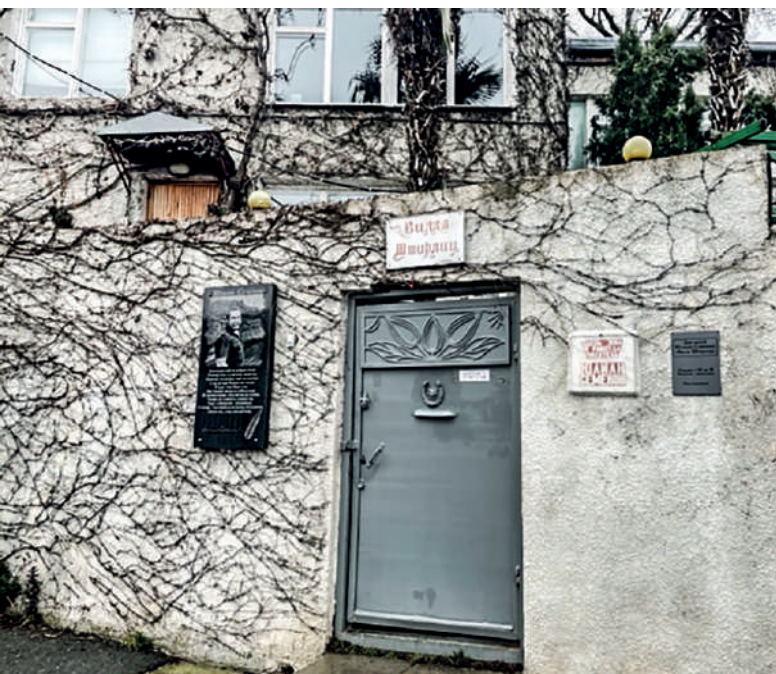
Дом-музей «Вилла «Штирлиц».