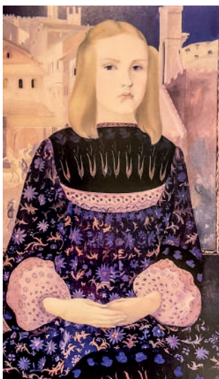
Портрет сестры Ольги. Третьяковская галерея.

“ПОРТРЕТ СЕСТРЫ ОЛЬГИ В 1982 ГОДУ ПОПАДАЕТ НА ВЫСТАВКУ «ТРАДИЦИИ И СОВРЕМЕННОСТЬ» В ПАЛЕ-РОАЛЬ В ПАРИЖЕ. ДАРЬЮ СЕМЁНОВУ ЗА ЭТОТ ПОРТРЕТ НАГРАЖДАЮТ СЕРЕБРЯНОЙ МЕДАЛЬЮ САЛОНА ФРАНЦУЗСКИХ ЖИВОПИСЦЕВ. ВПОСЛЕДСТВИИ ПОЛОТНО БЫЛО ПРИОБРЕТЕНО ГОСУДАРСТВЕННОЙ ТРЕТЬЯКОВСКОЙ ГАЛЕРЕЕЙ»