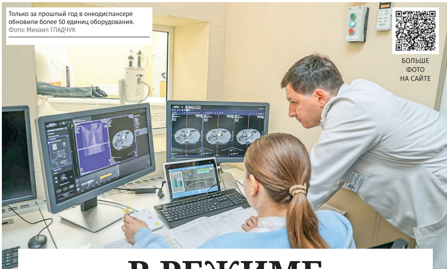
Только за прошлый год в онкодиспансере обновили более 50 единиц оборудования.