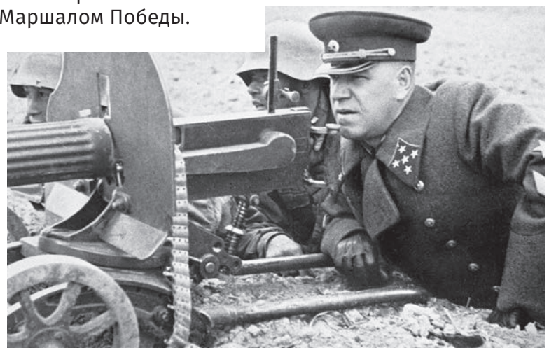
Генерал армии Г. К. Жуков на передовой. 1941 г.