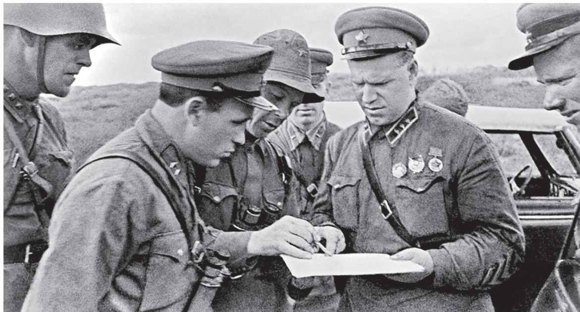
Комкор Г. К. Жуков на Халхин-Голе, 1939 г.

искусством ведения боя. Воюют умением, а не жизнями людей!»