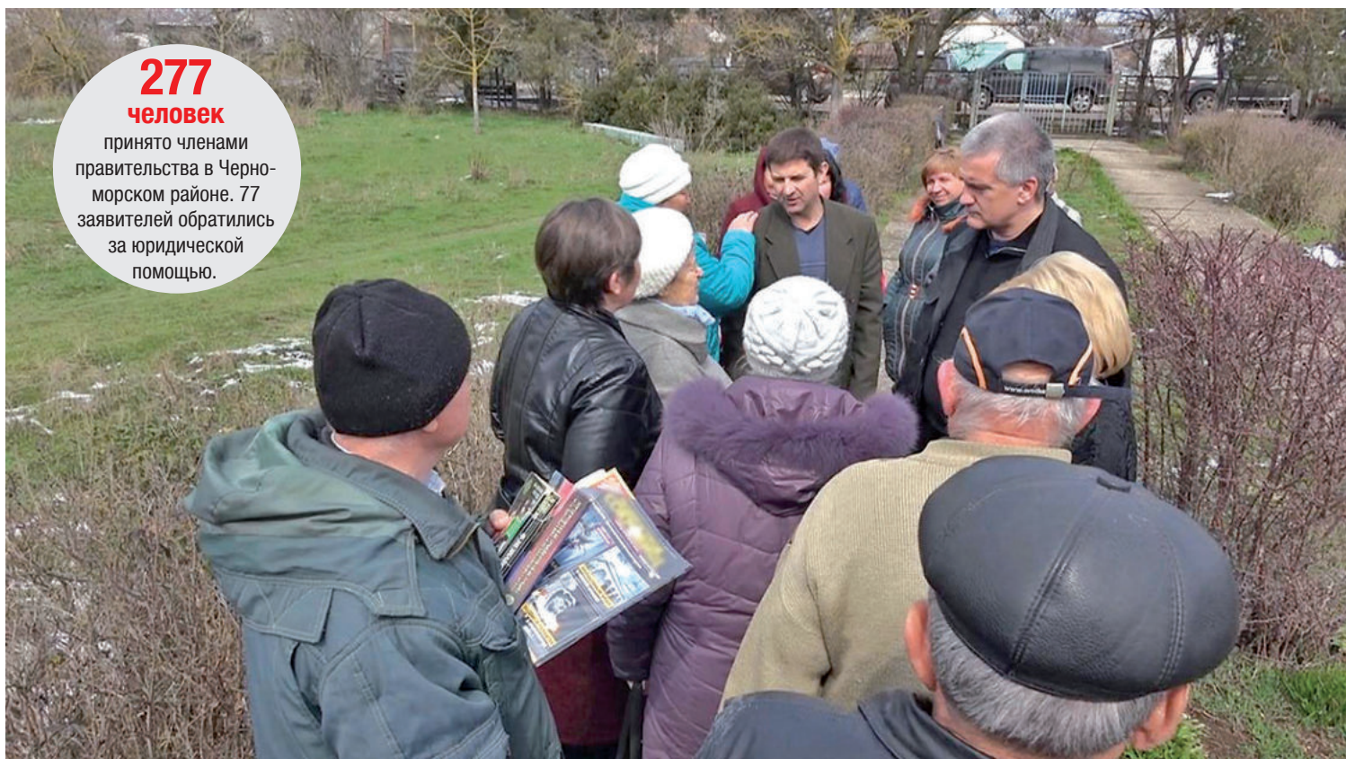
22 марта. Жители села Медведева Черноморского района беседуют с Главой РК Сергеем Аксёновым.

Начальник Межрегиональной инспекции ФНС России по Южному федеральному округу Юрий ВЫСОЦКИЙ.