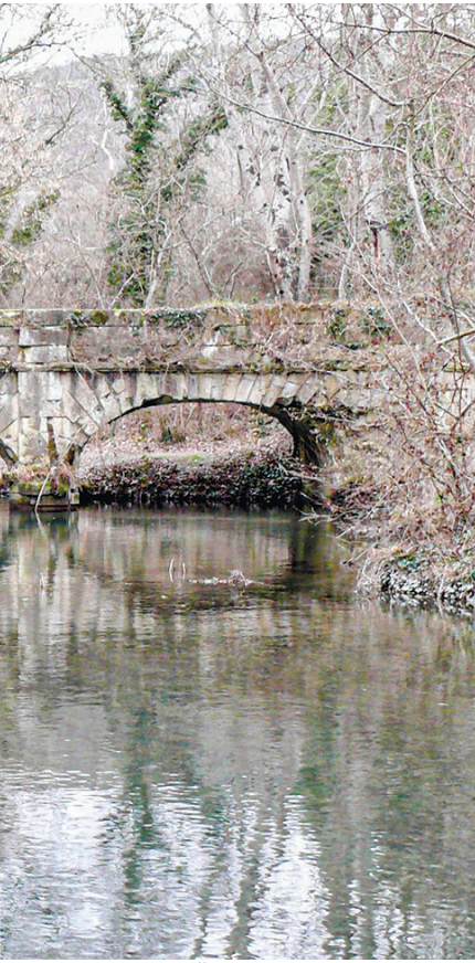
Реку Чёрную в Севастополе пересекает массивный каменный мост. Это акведук: 170 лет назад по нему текла вода, направляясь в доки адмиралтейства.