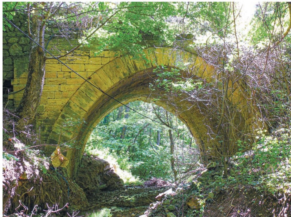
Мост, построенный в 1826 году на почтовом тракте из Симферополя в Алушту, вполне достоин звания объекта культурного наследия.

На подъездах к Гурзуфу шоссе выбегает на виадук, протянувшийся над долиной реки Авунды. Народное прозвище «Выражный мост» в полной мере отражает его конструктивные