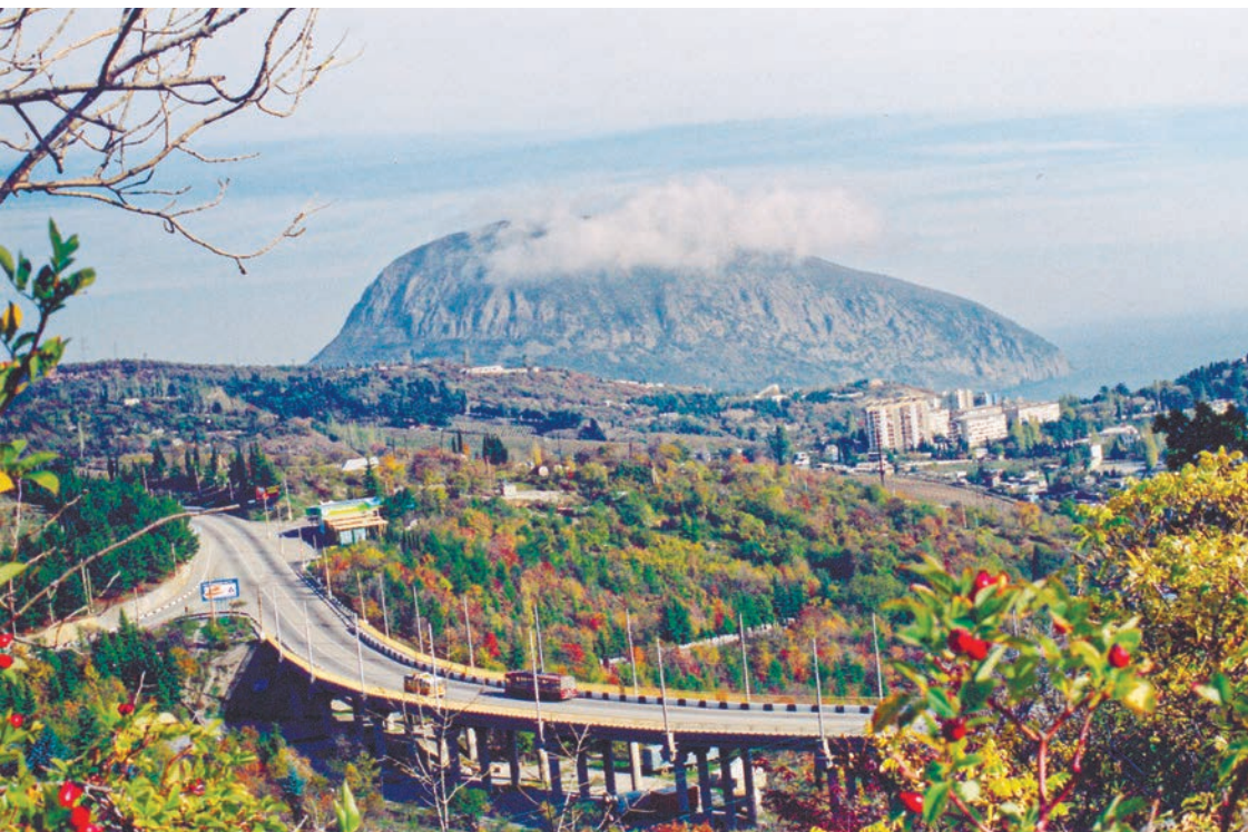
«Выражный мост» над Гурзуфом удивляет конструкцией: дугообразная форма обеспечивает большую устойчивость на крутом склоне.

особенности: на огромной железобетонной арке и мощных колоннах покоится изогнутый пролёт: дугообразная форма обеспечивает гораздо большую устойчивость на крутом склоне. Мост возведён в 1961 году и облегчает движение троллейбусов.