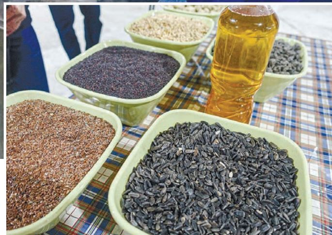
Теперь на предприятии будут перерабатывать также рапс, сою и лён.