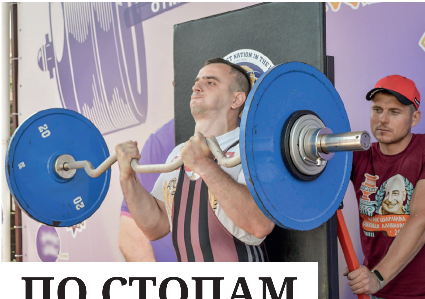
Турнир по силовым видам спорта «Кубок Шарлиева».