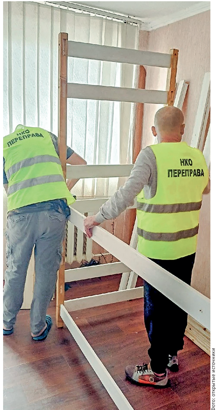
«Переправа» оборудовала свой центр помощи новой мебелью.

Среди других проектов-победителей есть инициативы по вовлечению