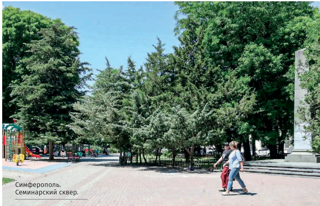
Симферополь. Семинарский сквер.