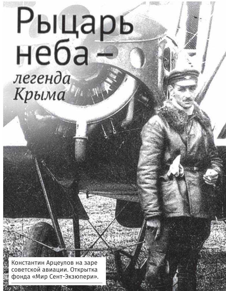
Константин Арцеулов на заре советской авиации. Открытка фонда «Мир Сент-Экзюпери».

« КОНСТАНТИН КОНСТАНТИНОВИЧ ПО ПРАВУ СЧИТАЕТСЯ ОДНИМ ИЗ ОСНОВОПОЛОЖНИКОВ ОТЕЧЕСТВЕННОГО ПЛАНЕРИЗМА, КОТОРЫЙ ДАЛ СТРАНЕ ЦЕЛУЮ ПЛЕЯДУ ПРОСЛАВЛЕННЫХ ПИЛОТОВ И ГЕНИАЛЬНЫХ КОНСТРУКТОРОВ, ВКЛЮЧАЯ АНДРЕЯ ТУПОЛЕВА И СЕРГЕЯ КОРОЛЁВА