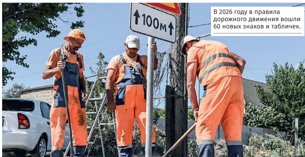
В 2026 году в правила дорожного движения вошли 60 новых знаков и табличек.