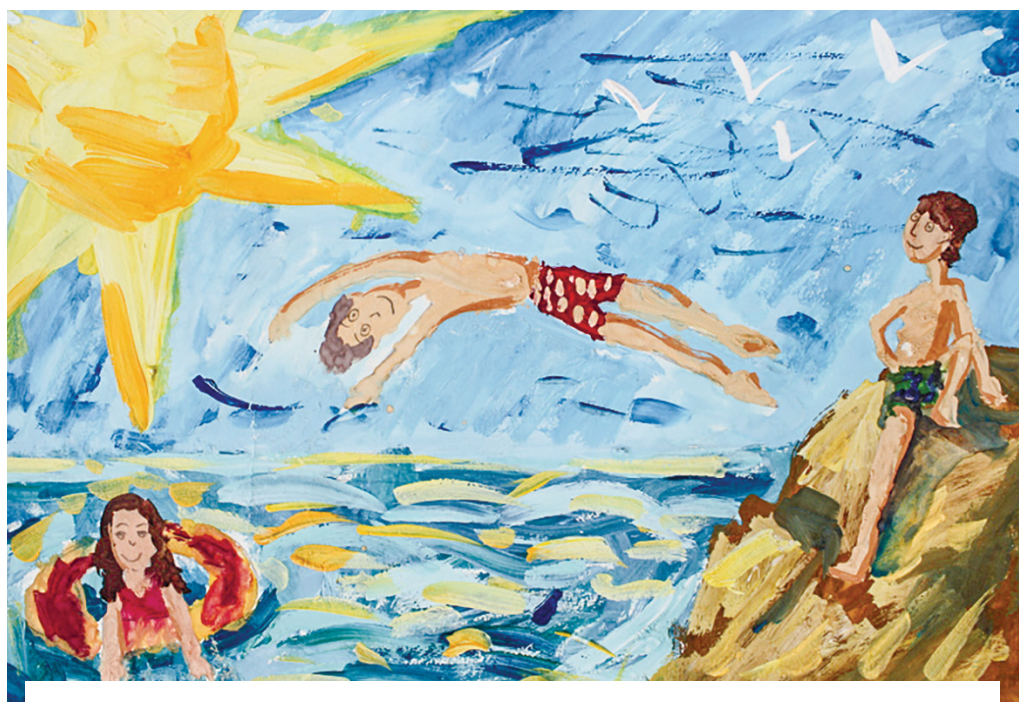
Рисунок с сайта библиотеки им. В. Орлова