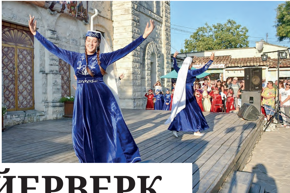
Украшением фестиваля стали крымскотатарские народные танцы в исполнении самобитных хореографических коллективов.

По традиции в первый день фестиваля в Центральной городской библиотеке имени Александра Пушкина состоялись «Ашикские чтения», посвящённые средневековому поэту-певцу Ашику Умеру (Омеру) (1621-1707), уроженцу Евпатории, которая в то время носила назва-