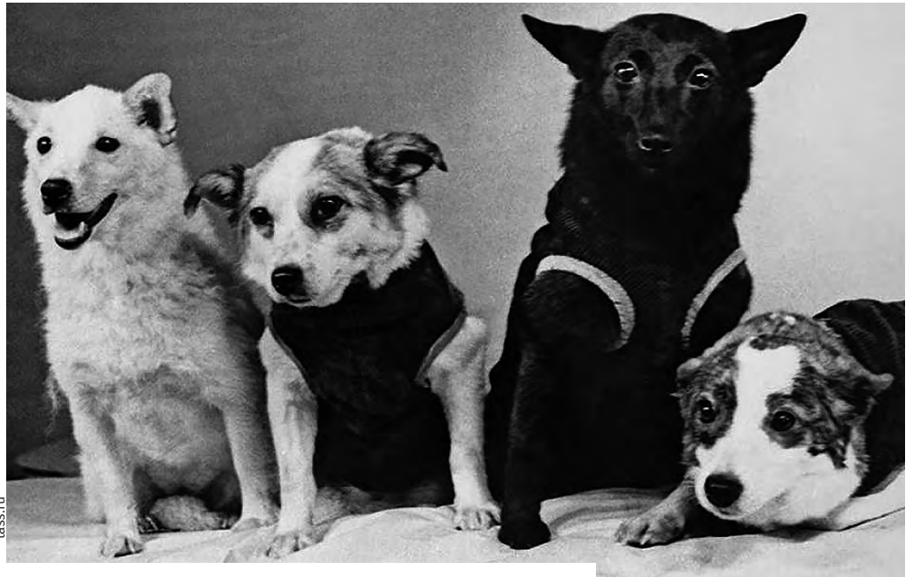
Слева направо: Белка, Звёздочка, Чернушка и Стрелка.

Клички первых орбитальных путешественниц Белки и Стрелки знают во всём мире. Собаки, ставшие первопроходцами-космонавтами, не были носителями породы – обычные дворняжки подошли на эту роль лучше всего. Конечно же, их