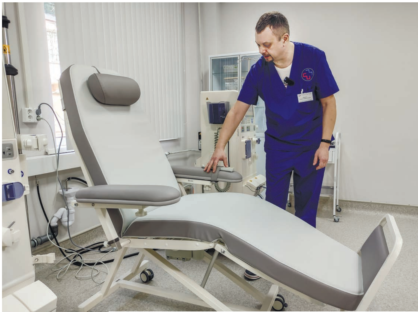
В Ялте приобрели восемь аппаратов для выполнения гемодиализа со специальными креслами.

Игорь ПЕТРЕНКО, русский актёр театра и кино.