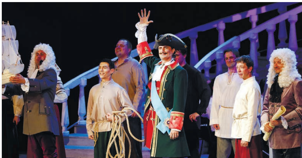
Сцена из спектакля «Табачный капитан».

Главной премьерой нового сезона, безусловно, станет знаменитая оперетта «Принцесса цирка». Музыкальный театр РК продолжает знакомить зрителей с изумительными произведениями Имре Кальмана, и крымские зрители уже по достоинству оценили и пленительную «Летучую