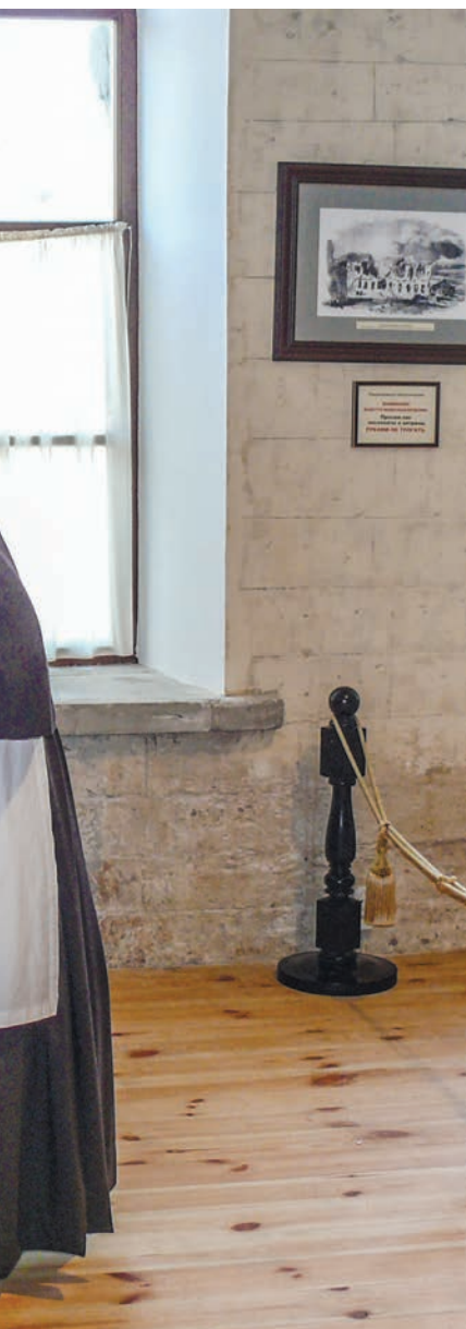
Инсталляцию, рассказывающую о сёстрах милосердия в Крымскую войну, можно увидеть в Севастопольском музее «Михайловская батарея».

баронессы Фредерикс близ Ялты. Имение получило название Джемиет (ныне посёлок Восход). Это слово имеет в крымско-татарском языке несколько значений: «совместная жизнь, служение, благотворительность». Спустя несколько лет здесь появились церковь и бесплатная больница.