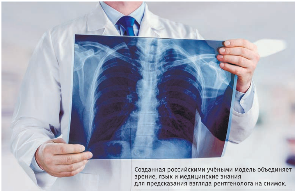
Созданная российскими учёными модель объединяет зрение, язык и медицинские знания для предсказания взгляда рентгенолога на снимок.

Результаты своих трудов разработчики представили на конференции по нейронным информационным системам NeurIPS. Специалисты вуза создали ИИ – помощника рентгенолога, который опирается не только на «картинку», но и на медицинские данные: анатомические, диагностические и другие сведения. В зависимости от задачи – например, поиска признаков пневмонии, сердечной недостаточности или контроля за заживлением переломов рёбер – врачи должны обращать внимание на разные части рентгеновского