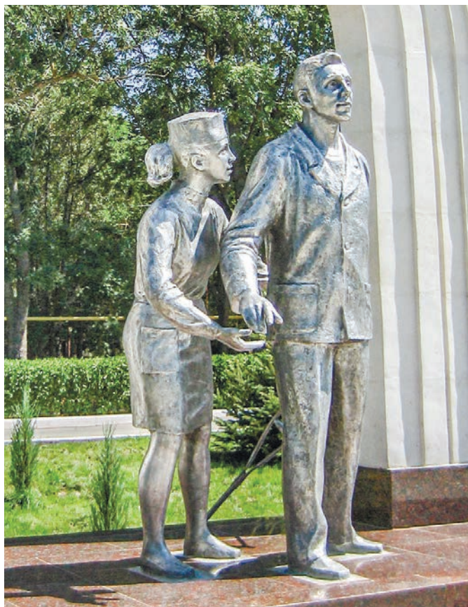
Выразительный памятник «Исцеление страждущих» установлен в парке Сакского военного санатория имени Н. И. Пирогова.