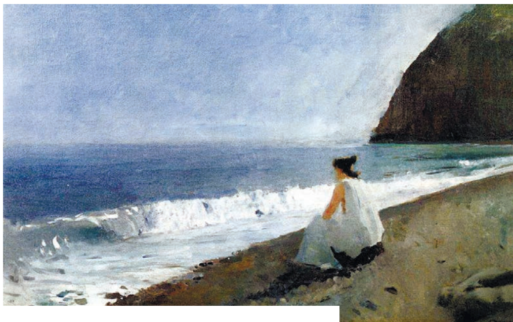
Валентин Серов передал на полотне тоску Ифигении о родине.

Древнегреческий драматург Еврипид в 414 году до нашей эры явил миру мощное действо: в стране жестоких тавров разыгрались нешуточные страсти. Жрицей в храме богини Девы, которой поклоняются местные жители, служит Ифигения – царская дочь, перенесённая на берега Негостеприимного моря волей рока. К ней приводят двух захваченных в плен чужеземцев, одного из них должны принести в жертву. Орест и Пилад спорят: каждый готов умереть