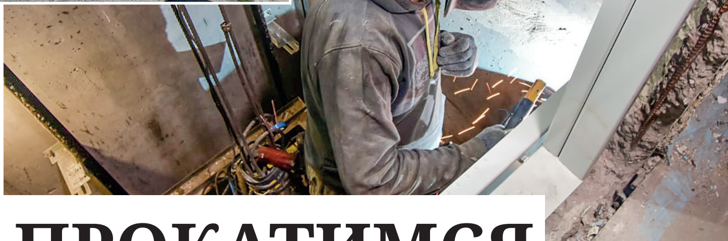
Лифт меняют – искры летят.