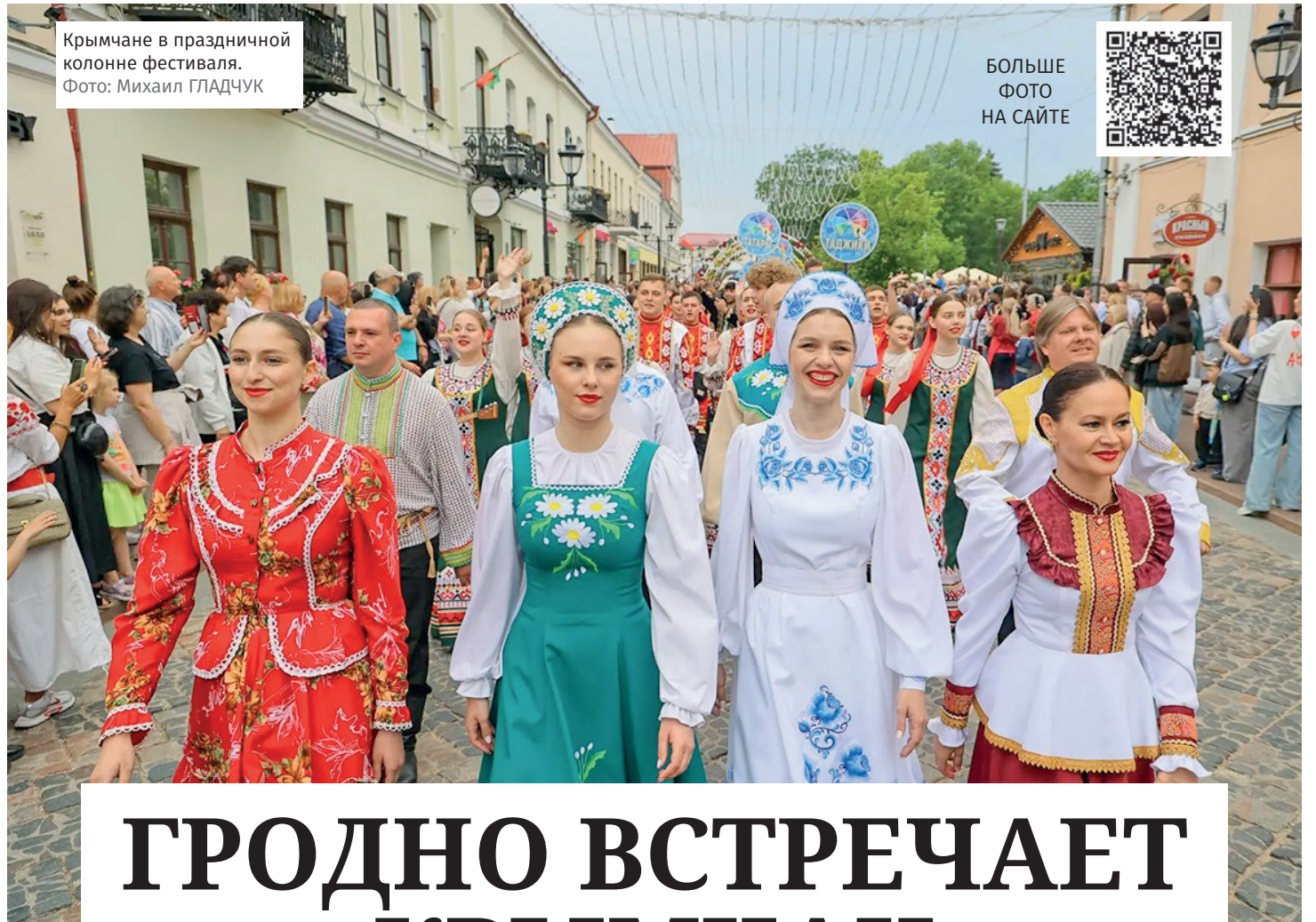
Крымчане в праздничной колонне фестиваля.

Наталья НИКОНОВА, замглавы Комитета Совета Федерации по международным делам, экс-глава МИД ДНР.