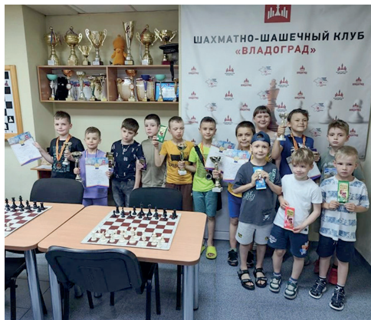
Фото шахматный клуб «Владоград»