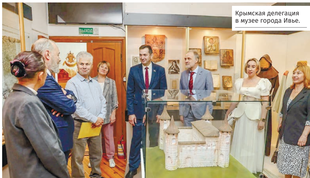
Крымская делегация в музее города Ивье.

– Мы всегда готовы принять своих братьев из Крыма. Надеемся, что сотрудничество будет продолжаться.