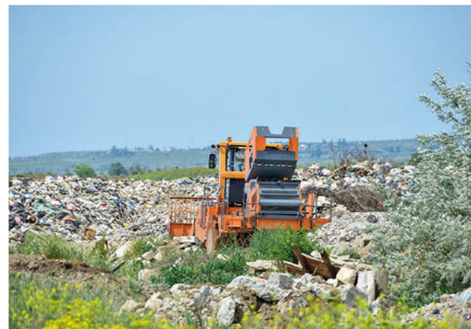
Полигон ТБО расширяют, что не слишком радует местное население.