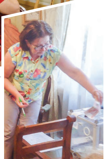
Деньги за картины после аукциона опускали в прозрачный печатанный ящик.