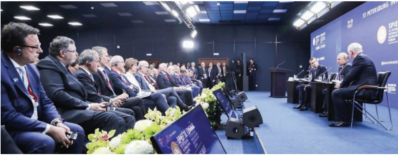
Президент России Владимир Путин и президент Франции Эмманюэль Макрон приняли участие в панельной дискуссии «Бизнес-диалог Россия – Франция», которая прошла в рамках Петербургского международного экономического форума.