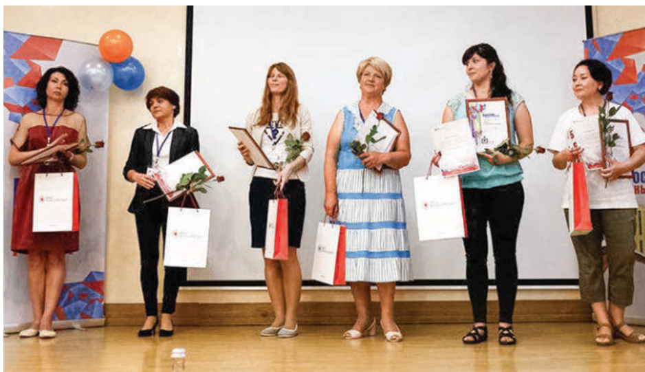
Финалисты конкурса «Лучший библиотекарь Республики Крым».

Деятельность библиотеки не ограничивается выдачей книг, сегодня учреждение действует как клуб. Здесь играют, поют, встречаются с интересными людьми. Заведующая надеется, что в этом году помещения отремонтируют, и в здании станет боль-