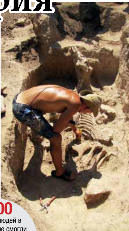
Археолог расчищает скелет лошади.

На могильнике обнаружено множество конских захоронений. Причём, поясняет Игорь Храпунов, кони обузданы – во рту у них обнаруживают псалии, которые археологи любят, поскольку это помогает точнее установить дату захоронения. Лошади лежат на жи-