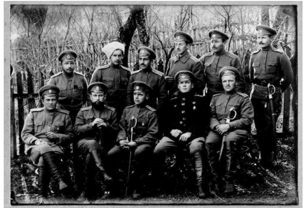
Офицеры 51-го пехотного Литовского полка. 1916 год

Кладбище прекрасно ухожено. Судя по анализу списков раненых, поступавших в тыловые госпитали, там захоронены не менее тысячи человек из числа личного состава 13-й пехотной дивизии, из которых 80-90% – крымчане. Это единственное в мире захоронение, где лежат почти только одни жители Крыма, погибшие при исполнении воинского долга.