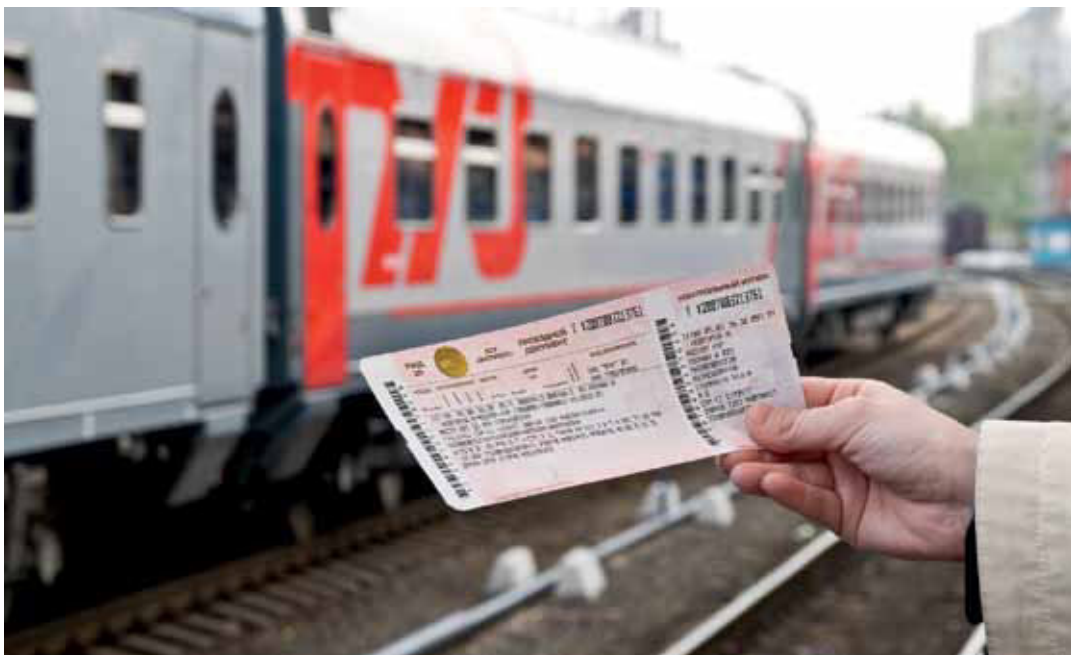
Ради комфорта пассажиров РЖД переходит на местное время.

Соответственно поменяются бланки билетов и данные на информационных табло, установленных на вокзалах или внутри самих поездов. Компания рассчитывает таким образом повысить уровень обслуживания пассажиров. Кстати, новые бланки билетов должны были появиться в продаже ещё в мае.