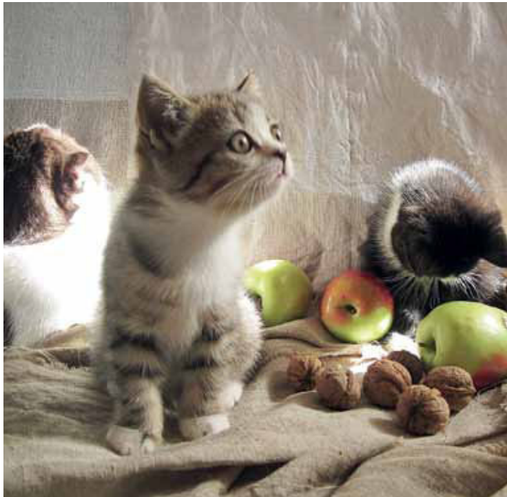
Даже маленькие котята иногда смотрят в пространство так, как будто видят там нечто сверхъестественное. На этом фото котёнок увидел пролетающего мимо комара (комар в кадр не попал, но фотограф его тоже заметил).

– Я люблю фотографировать, в том числе фотографирую кошек, причём, как правило, в домашних условиях. Взрослые, бывает, боятся съёмки, могут зажиматься, а с котятами другая проблема – усадить и заставить хоть немного попозировать. Но однажды снимала котёнка, который сначала вёл себя как все