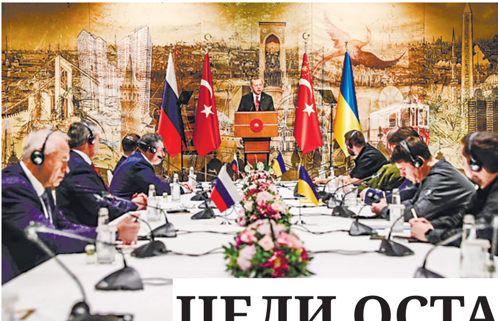
Последний раунд переговоров между РФ и Украиной состоялся в Стамбуле 29 марта 2022 года.