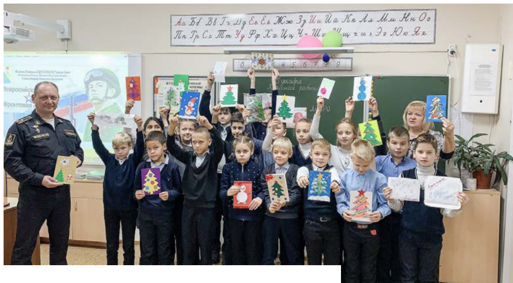
Школьники со своими работами.

Ещё совсем недавно общественным идеалом считались свобода личности, комфорт и экономическое