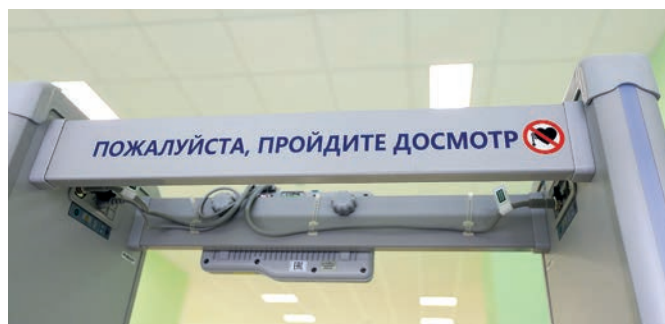
Школа обеспечена инновационными комплексными мерами безопасности.

– Это замечательный образовательный центр, который оснащён самым современным оборудованием как для решения учебных задач, так и обеспечения комплексной безопасности, – рассказывает министр образования, науки и молодёжи РК Валентина Лаврик. – Уже назначен руководитель образовательной организации, которая формирует штат, и определены педагоги, которые будут работать в центре. Школа будет закрывать потребность в