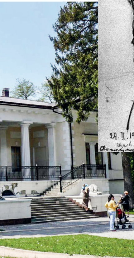
«Воронцовский дворец» в имени Салгирка (ныне Ботанический сад КФУ) подарил учёному покой и обеспечил условия для творческой работы.

Но пока – условия жизни угнетают. «Ниночка сшила мне сюртучок из мешка», – горестно отмечает профессор. Он всё более убеждается в необходимости отъезда из страны. «Думаю о Лондоне, – признаётся себе Владимир Иванович. – Хочется иметь могучее орудие, какое даёт большая библиотека и лаборатория».