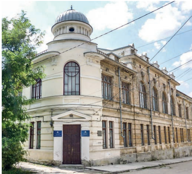
Здесь, на углу улиц Студенческой и Курчатова, находился кабинет Вернадского в бытность его ректором Таврического университета.