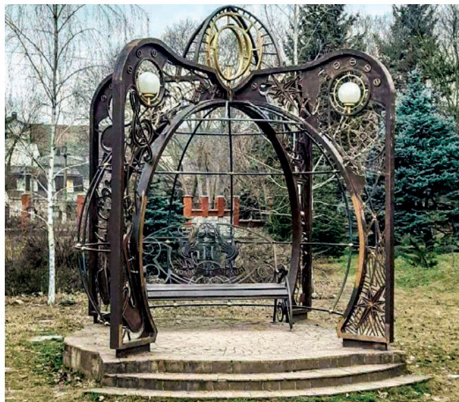
«Ноосферная беседка» – своеобразное олицетворение учения Вернадского – украшает Ботанический сад Крымского федерального университета.

Предприняли все меры предосторожности, но избежать беды не удалось. Началась горячка. Врач озабоченно молвил: «Сыпняк. Тяжёлый».