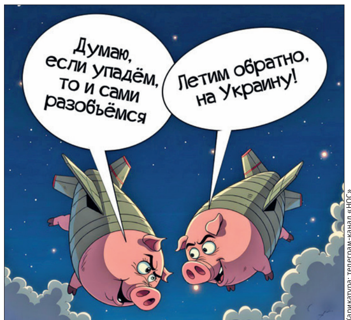
apartment, but I don't plan to move into it.