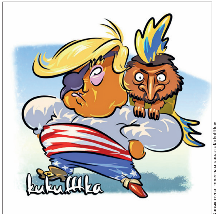
reputation, but their poor financial management

От окончательного унижения солдат США спасло лишь то, что финны начали поддаваться, чтобы американцы не почувствовали себя деморализованными и смогли в конечном итоге победить. Конечно, им Гренландию ещё брать, а не бубенцами в проруби брэнчать.