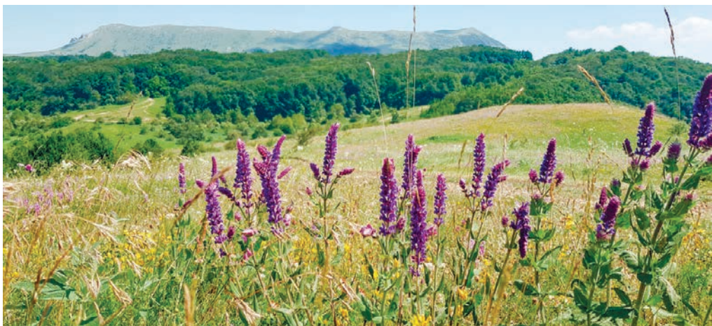
«Отправились в горы на несколько дней. Было хорошо, пахло чабрецом и мятой, напоминало мне плоскогорье Чатыр-Дага», – пишет Эренбург, доселе никогда не бывавший в Крыму, из Парижа Волошину.