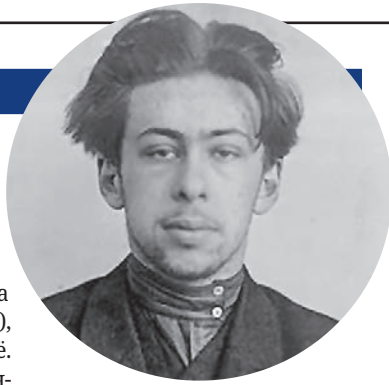
Эренбург Илья Григорьевич (1891–1967) – поэт и публицист, «наделённый безжалостно чётким видением действительности», писатель, оказавший огромное влияние на литературную и общественную жизнь СССР.

Верный языку символов, поэт подчёркивает: «Со дня моего приезда в Коктебель меня ждал главный собеседник – тот Сфинкс, что задал мне в Москве загадки, но не получил ответа».