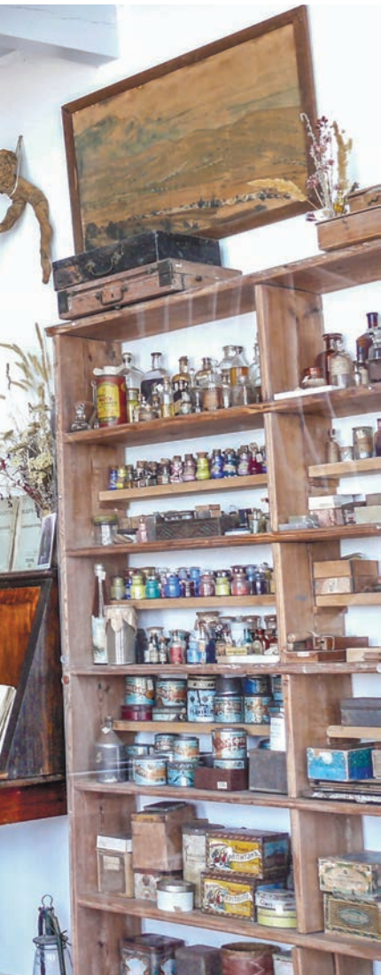
Интерьер дома Волошина в Коктебеле. «Войдя в его мастерскую, я вспомнил Париж: та же царевна Таиах, полки с книгами, предпочтительно французскими. Мы подолгу беседовали», – вспоминает Эренбург.